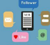
Social Media Manager