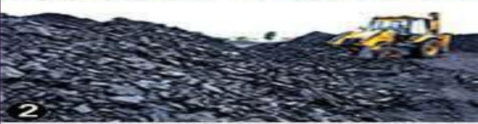
1. Forest Resource 2. Coal